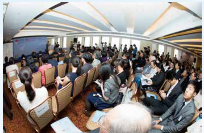
社會上多方人士蒞臨支持。