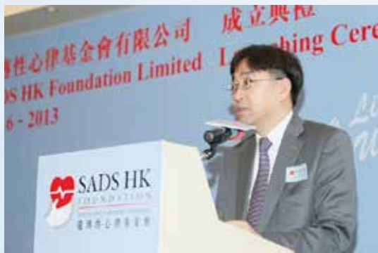
香港特別行政區食物及衛生局高永文局長致辭。

心律會成立目的，是為了提高公眾及醫療界對SADS的認識和警覺，減低因心律不常而猝死的風險，令SADS患者活出豐盛的人生。